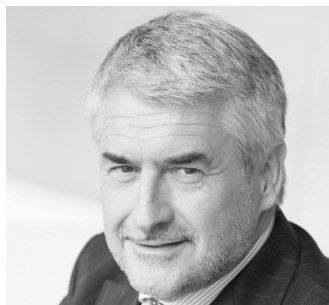
Rudy Provoost, PDG, Rexel

« explorer de nouvelles idées créatrices de valeur durable »