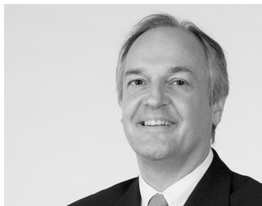
Paul Polman, PDG, Unilever

Chez Unilever, nous croyons que les entreprises font partie de la solution. Une croissance durable et équitable est le seul modèle acceptable. Mais pour cela, le business doit changer. Nous devons apprendre à travailler ensemble. Nous avons chacun un rôle à jouer. Chaque entreprise a des activités et des compétences qui lui sont propres. En collaborant avec d'autres entreprises engagées comme nous, nous pouvons bénéficier des compétences, de la portée et des réseaux dont nous manquons pour développer ensemble des nouveaux business models rentables et durables.