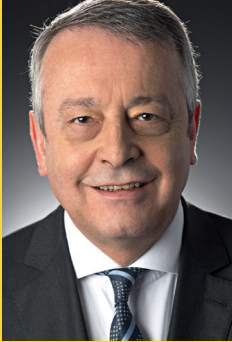
Антуан Фреро, Голова правління та Генеральний директор компанії Веолія

відповідних рекомендацій міжнародних організацій, зокрема дотримуючись фундаментальних принципів, з урахуванням культурного розмаїття та сприяючи охороні навко лишнього середовища.